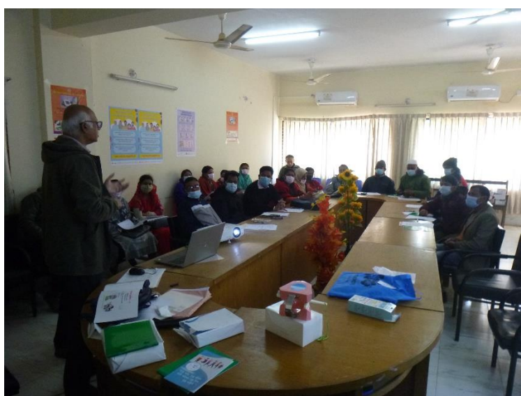
21名参加の Mini-Seminar 18-Jan.-2023 Barlekha Health Complex