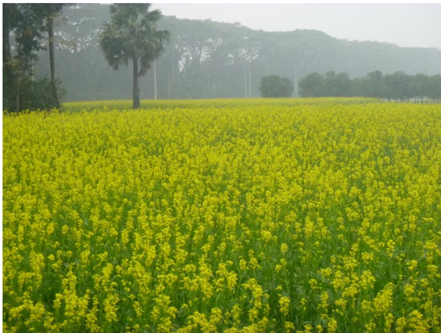
いちめんの菜の花：山村暮鳥の詩のとおりでした

1月16日 今日も 06:00 起床、入浴、洗濯。 07:15 バリダラ公園で“歩行訓練？”。07:45 NGHに戻り朝食。 明日の“旅”の準備開始。Mini-Seminar の発表内容の確認。 11:00、GPS 携帯受領のため、XX と YY で事務所へ。「受領」 近くのピザハットで昼食。 ZZ で帰館し、昼寝+NGH に残す荷物の整理を行い、18:00 に 総数 9 個を引き渡す。 19:00、ピザの残りとお茶で夕食+お茶で、二人してまったり した。その後データ整理とプレゼン準備。24 時をまわったので もう寝ます。